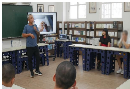
113 年 10 月 22 日辦理生涯系列活動-企業主講座(三)