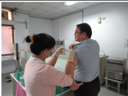
113 年 10 月 21 日辦理收容學生與同仁疫苗接種