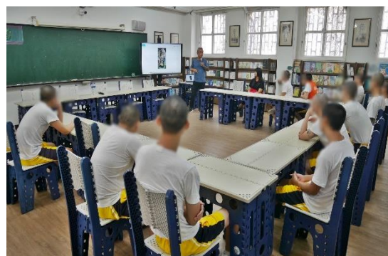
透過畫作傳達獄中生活的樣貌、倡議環保性別等議題，說明身為藝術創作者的社會責任。