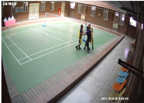
113 年 10 月 24 日辦理 113 年度應變演習，模擬學生聚眾滋事，並挾持班級教導員。