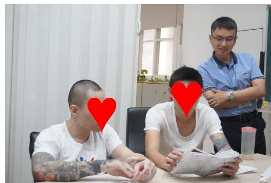
學生們帶來自己珍藏的孩子及家人照片，與大家分享