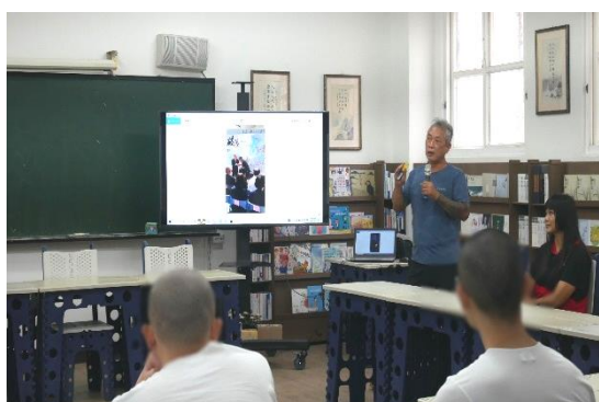
講座主題以：「耕生不鏽的路途」為主軸，引導學生思考為人子女對於孝道的體悟，與家人相處應及時表達「愛」與「感恩」