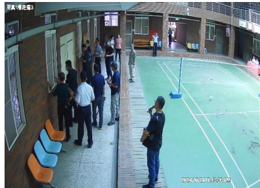
臨床心理師與學生進行對話並安撫情緒。