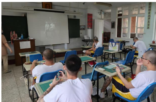
以影片/活動形式讓學生們更理解修復式正義/司法之精神(一)