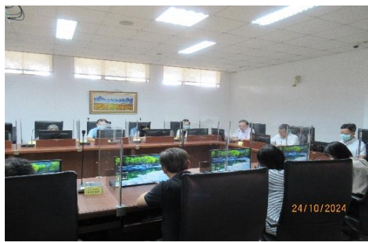
演習後吳視察文持於簡報室進行講評。