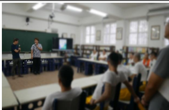
113 年 10 月 18 日辦理生涯系列活動-企業主講座