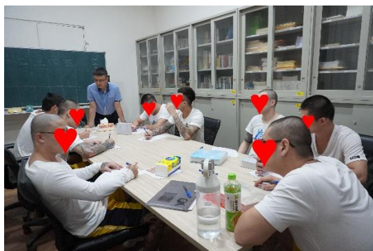
113 年 10 月 18 日辦理親職教育講座-正念教養