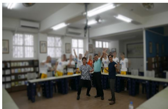
講座主題以：「從學習中找到成長契機」並以活潑生動的方式帶領學生