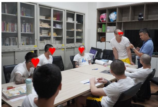
透過介紹被採訪者的過程，主動性及開口表達的練習，