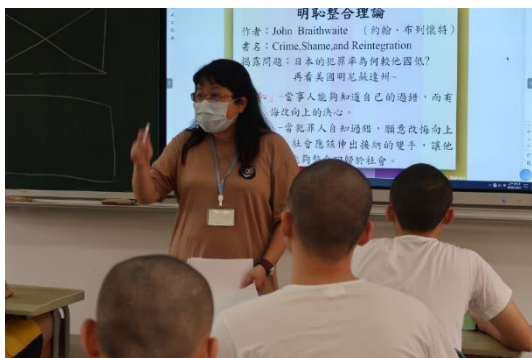
113 年 10 月 21 日辦理修復式正義宣導活動課程