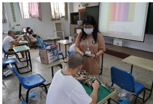
以影片/活動形式讓學生們更理解修復式正義/司法之精神(二)