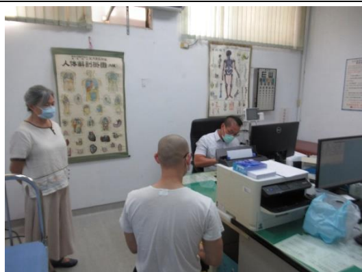
醫師實施注射前評估