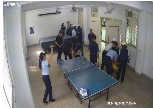
鎮暴小組攻堅進行壓制後上銬逮捕。