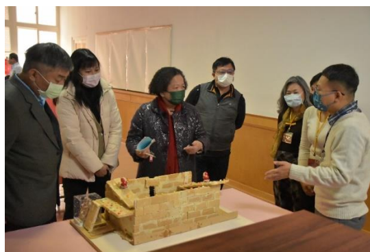
督導小組欣賞學生作品 -- 薑餅屋