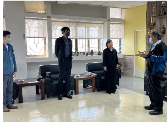
涂校長對委員表達治校理念、學校各方面軟硬體新設施及未來展望