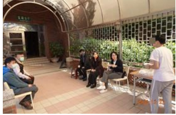
在施秘書及鄭主任陪同至女生班瞭解烤肉實況