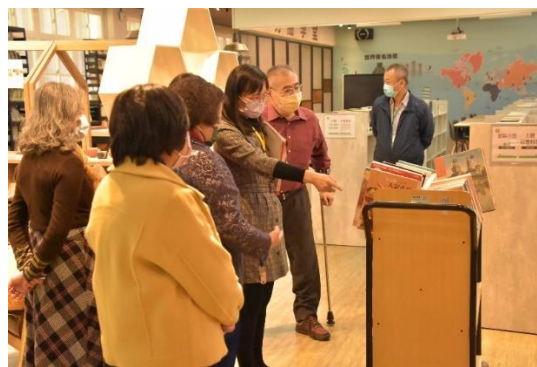
訪視委員了解學生借閱，待上架書目