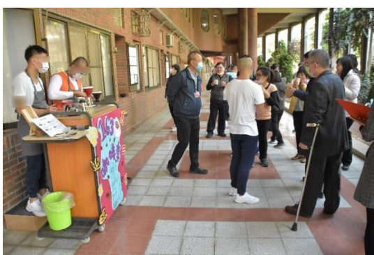
行動咖啡車—學生推廣手沖咖啡