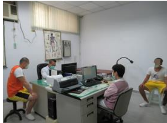
醫師實施注射前評估