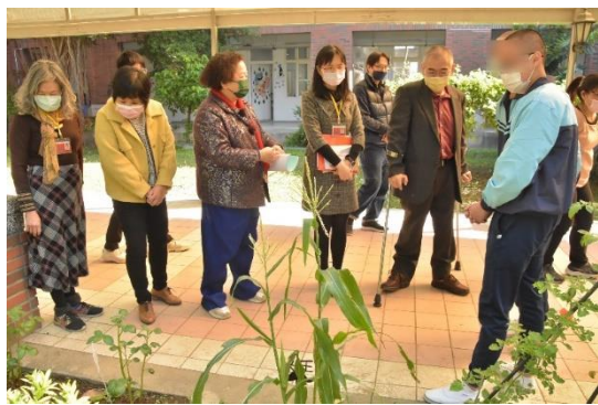
學生導覽園藝實作