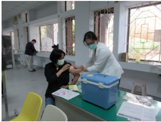
111 年 12 月 12 日延請國軍高雄總醫院岡山分院蒞校實施收容學生及教職同仁默德納次世代疫苗接種。