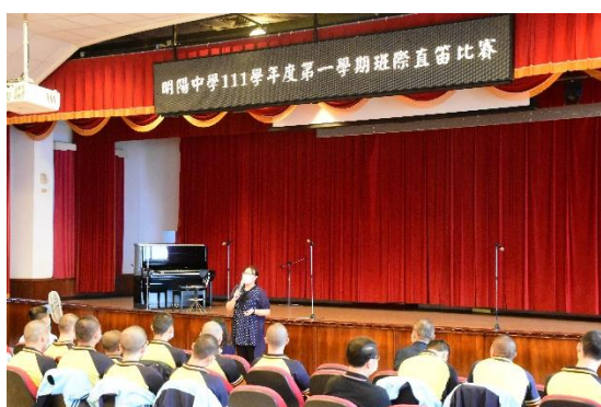
比賽結束時由音樂老師講評情形