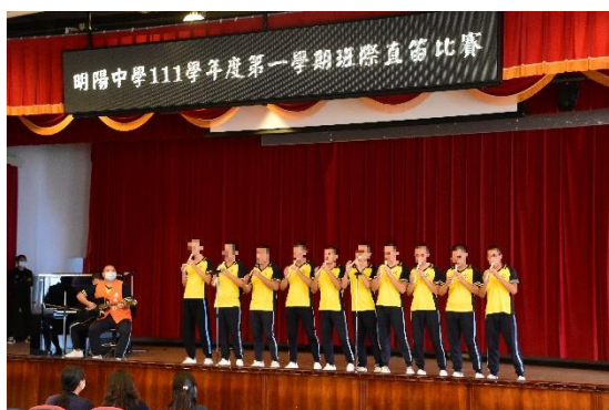
111年12月13日在本校大禮堂舉辦111學年度第1學期班際直笛音樂比賽。