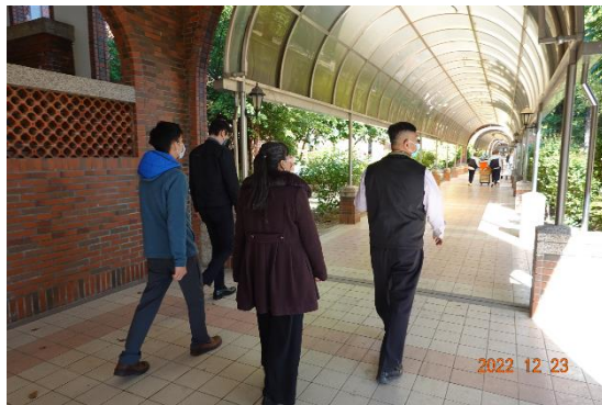
委員們進入校區參訪全校學生烤肉活動