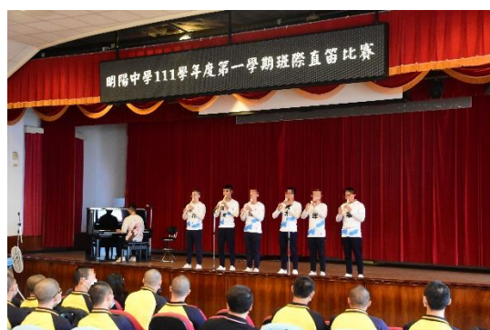
直笛音樂比賽學生演出情形(1)