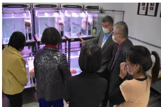
督導小組水族社觀賞魚導覽