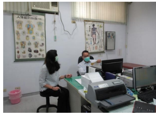
醫師實施注射前評估