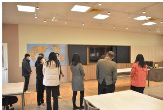
參觀新活化空間--美術教室