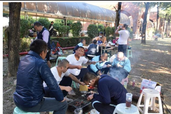
學生於烤肉活動中與老師歡樂互動情形