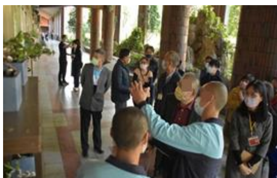
學生植栽作品導覽