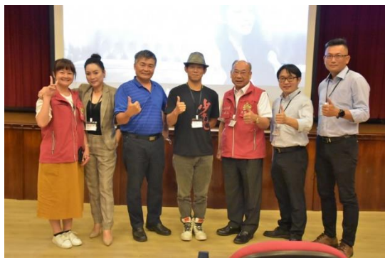
活動贊助單位-臺灣更生保護會高雄分會、橋頭分會邀請來賓與顏正國導演合影