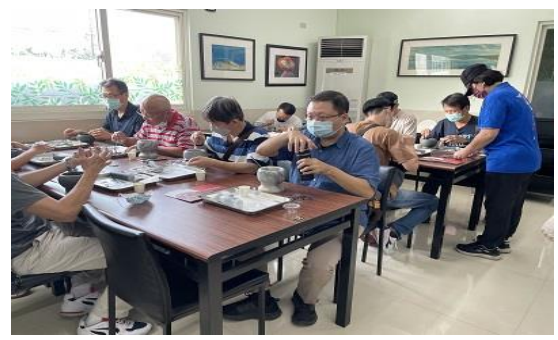
環境教育活動學習製作巧克力