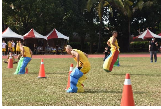
趣味競賽(袋袋相傳)比賽情形