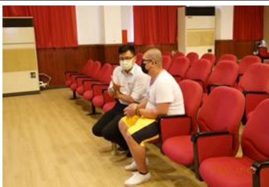
禮堂進行法治教育暨法律諮詢，學生踴躍發問律師有關課程及個人面臨法律問題、提問，獲專業回覆解答