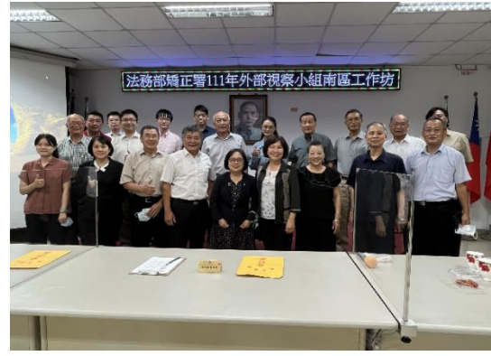
葉副署長與南區外部視察小組委員全體大合照(二)