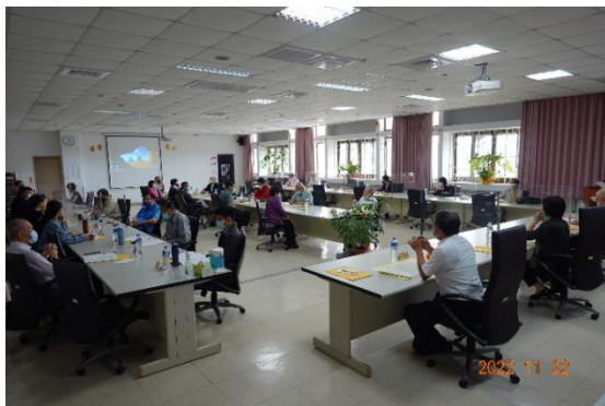
葉副署長主持南區外部視察小組工作坊(一)