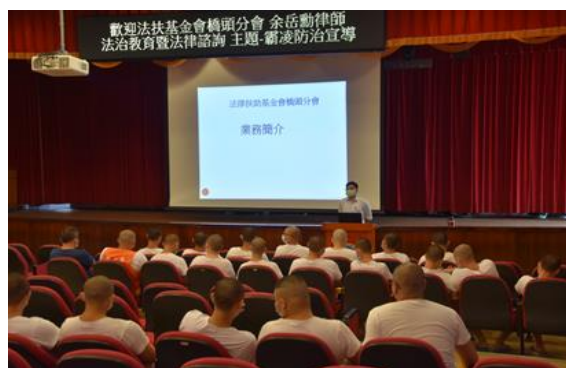
111年11月18日辦理法治教育暨法律諮詢宣導課程講座