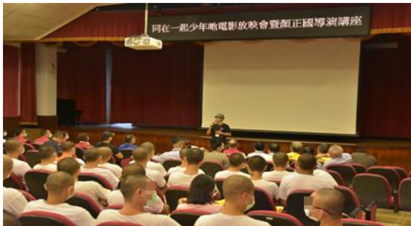
顏正國導演講座-分享走進高牆前、服刑時與出監後面臨的種種衝擊與選擇