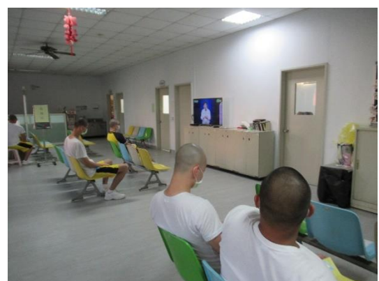
等待醫師實施注射前評估