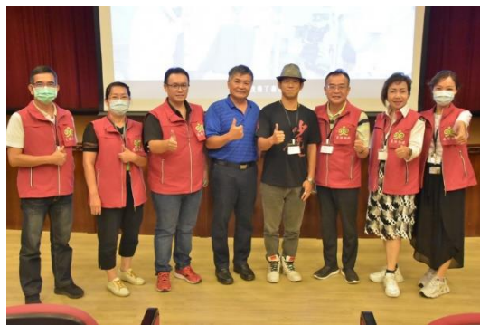
活動贊助單位-臺灣更生保護會高雄分會、橋頭分會邀請來賓與顏正國導演合影