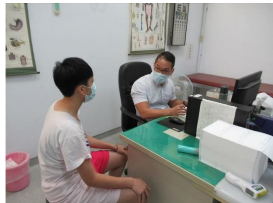
醫師實施注射前評估