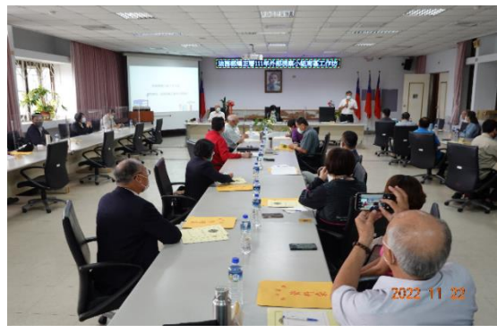
葉副署長主持南區外部視察小組工作坊(二)