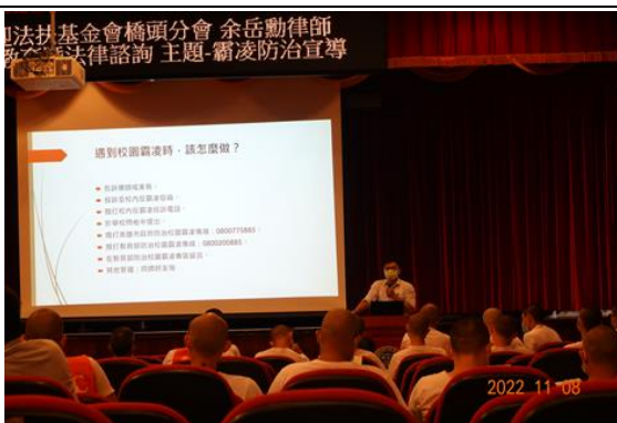
課程活潑生動精彩，本校教職同仁、學生獲益良多