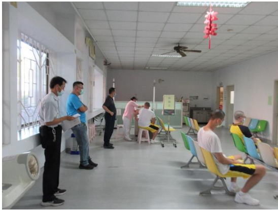
111 年 11 月 28 日學生新冠疫苗接種