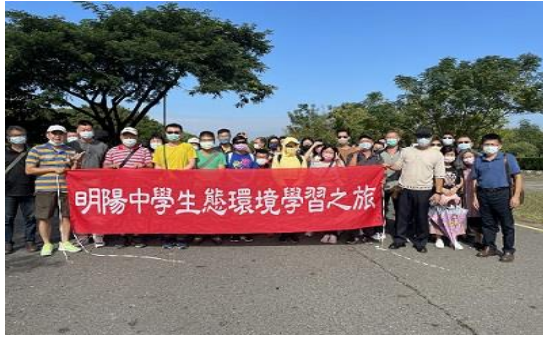
111 年 10 月 25 日及 11 月 3 日辦理本校環境教育活動，全體教職員工合照。