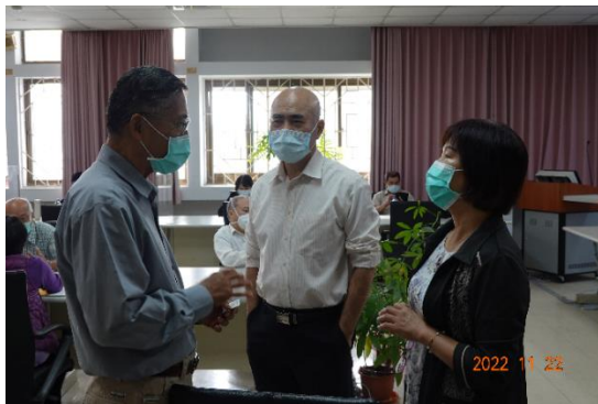
葉副署長、林組長與委員經驗分享