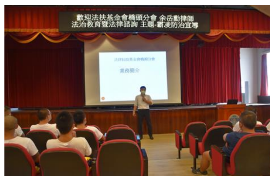
課程強化校園霸凌防治實務宣導課程介紹與說明