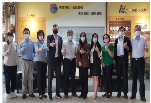
涂校長、蔡副校長與考評小組成員合影