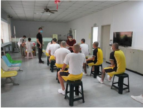
111 年 4 月 18 日實施教職員與收容學生施打默德納疫苗，向學生說明疫苗注射後注意事項