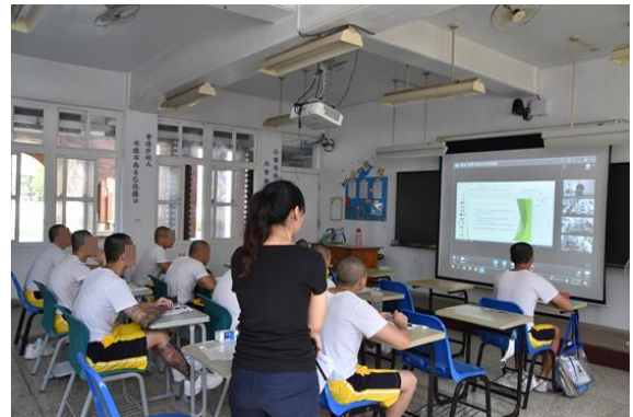
收容學生於教室內上課學習情形