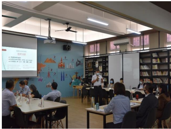
涂校長回答考評小組委員提問之問題