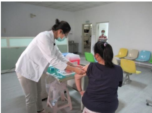
本校教職同仁默德納疫苗接種