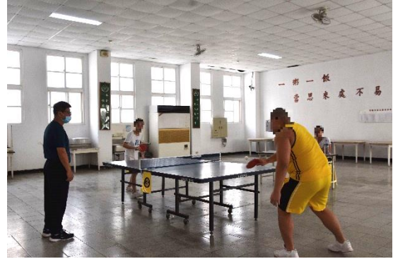
全校班際桌球比賽情形(1)