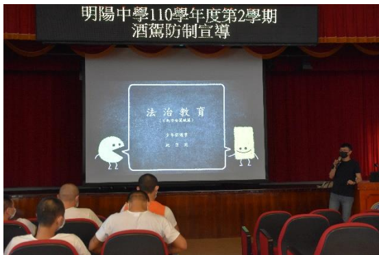
法治教育課程處遇，建構學生酒駕防制法學素養。