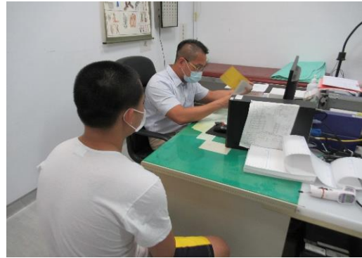
醫師實施注射前評估