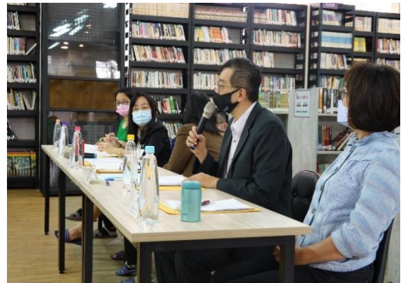
考評小組委員針對校務簡報提問