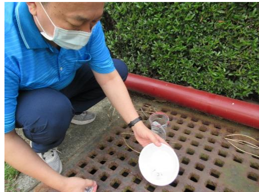
放養野生食蚊魚苗以生物防治法進行登革熱病媒蚊防治。