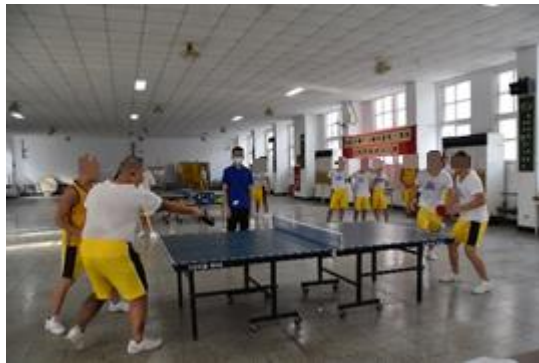
全校班際桌球比賽情形(2)