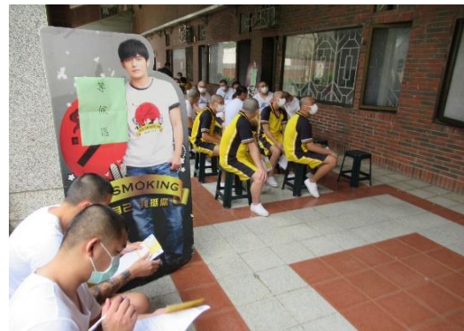
本校收容學生默德納疫苗接種報到及休息區