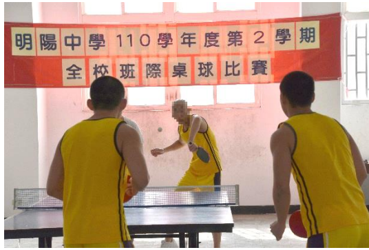
111年4月26日辦理全校班際桌球比賽