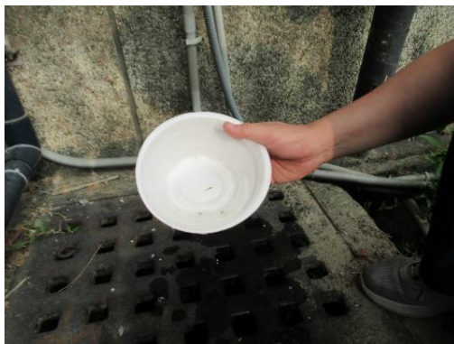
111 年 4 月 20 日放養野生食蚊魚苗於校內溝渠