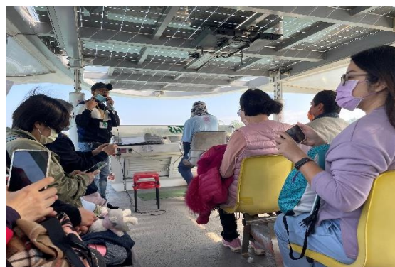
本校教職員工搭乘太陽能遊艇遊烏山頭水庫。