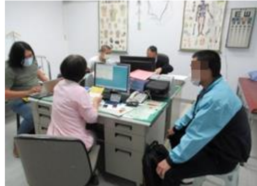
醫師實施注射前評估