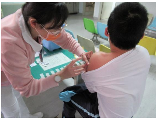
本校收容學生 BNT 疫苗接種