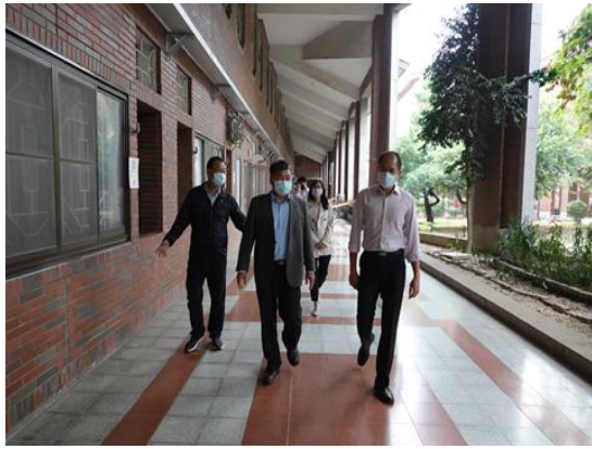
學習司法官參觀校內各項設施