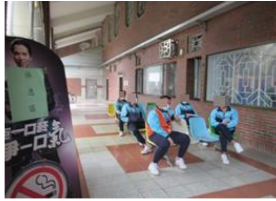
本校收容學生 BNT 疫苗接種後休息區