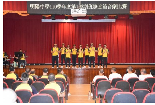
直笛音樂比賽學生演出情形(1)