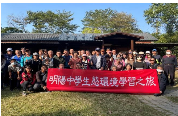
110 年 12 月 7 日及 12 日辦理本校環境教育活動全體教職員工合照。