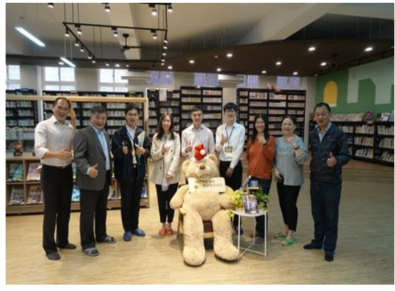
學習司法官參觀圖書館