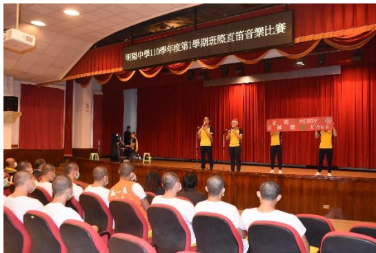
直笛音樂比賽學生演出情形(2)