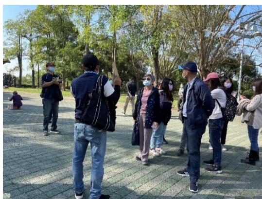
本校教職員工仔細聆聽導覽講解情形。