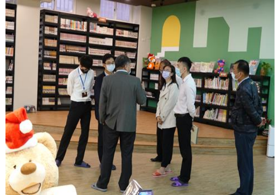
司法官參觀本校創課中心