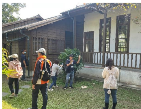
本校教職員工參觀八田與一紀念館。