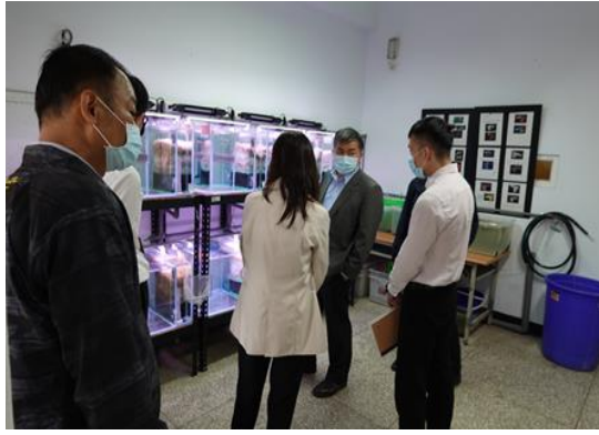
於本校簡報室進行簡報(二)