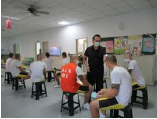
10月18日流感疫苗接種前體溫量測