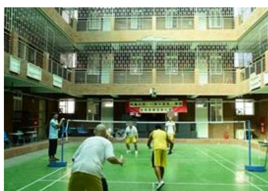
全校班際羽球比賽情形(3)