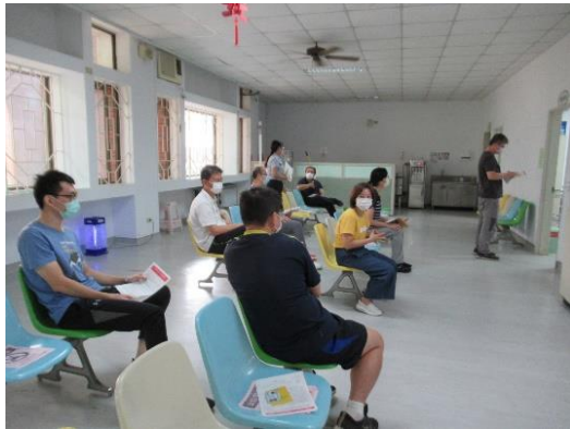
10月29日教職員工新冠肺炎默德納疫苗第二劑接種