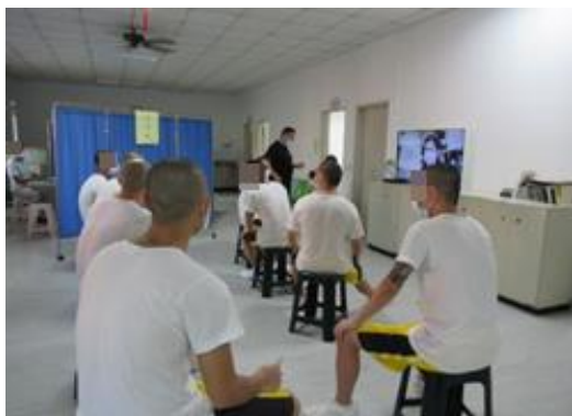
10月4日國軍高雄總醫院岡山分院及燕巢衛生所蒞校實施收容學生新冠肺炎 BNT 疫苗第一劑第二梯次接種