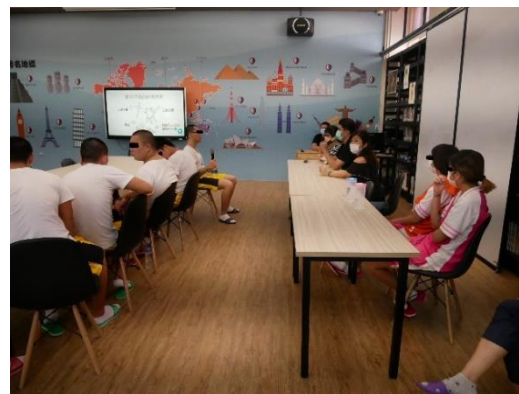
學生專注聆聽演講。