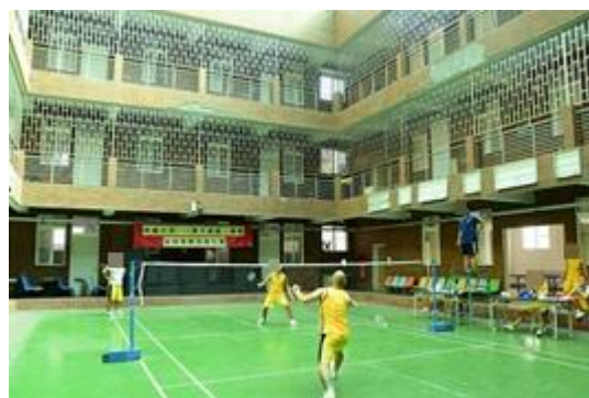
全校班際羽球比賽情形(1)