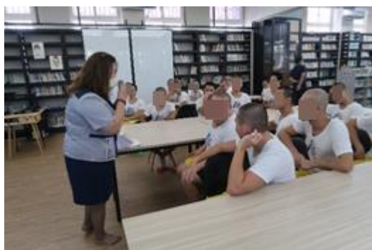
學生與講師互動熱絡(一)