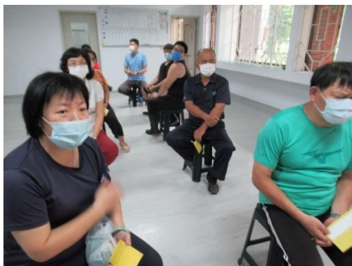
10月14日教職員工新冠肺炎 AZ 疫苗第二劑接種