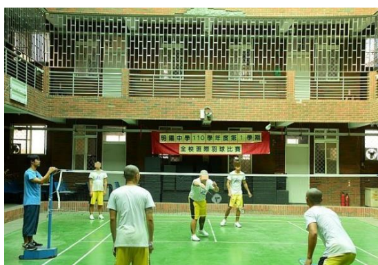
全校班際羽球比賽情形(2)