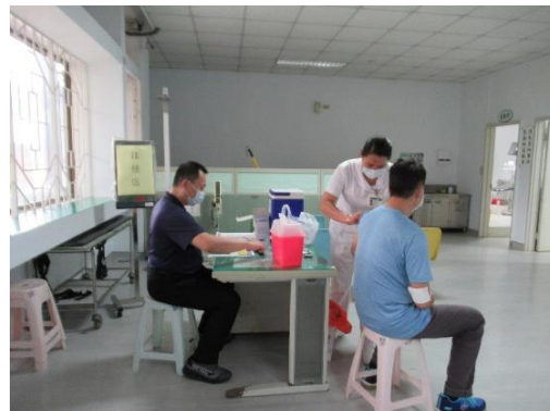
教職員工新冠肺炎 AZ 疫苗第二劑接種