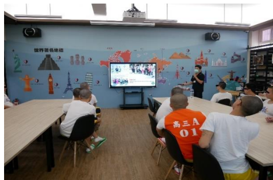
講師分別描述在創業後遇到疫情如何帶領團隊克服難關。