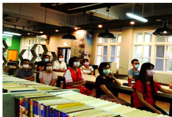
講座現場-吧台區坐滿聽講師生