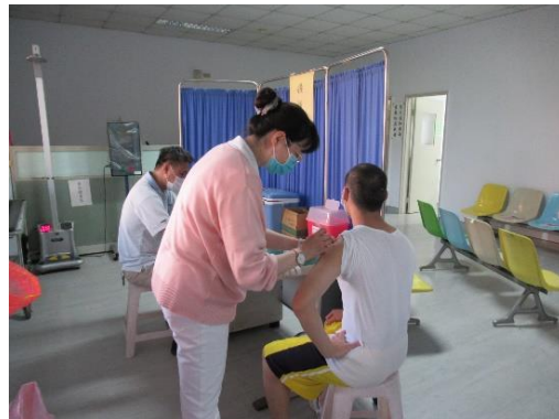
學生 BNT 疫苗接種