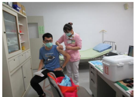
教職員工新冠肺炎默德納疫苗第二劑接種