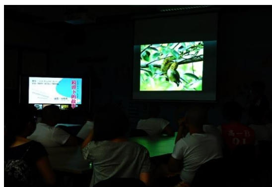
師生津津有味聆聽講師介紹校園鳥的生態觀察