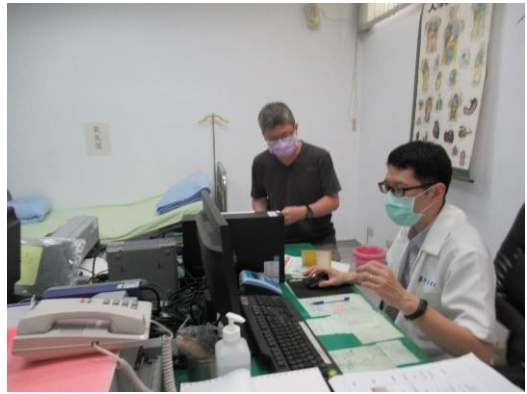
教職員工新冠肺炎默德納疫苗第二劑接種前評估