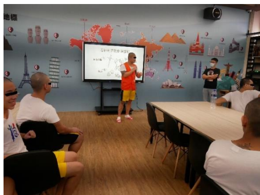
出校李同學一路陪在身邊，也分享所看到他的奮鬥辛苦歷程。