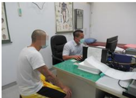
醫師實施疫苗注射前評估