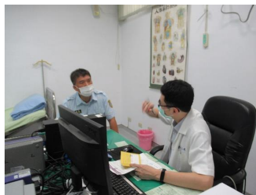
教職員工新冠肺炎 AZ 疫苗第二劑接種評估