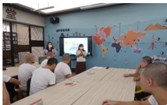
學生與講師互動熱絡(二)