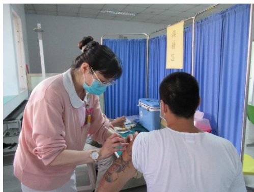
學生 BNT 疫苗接種