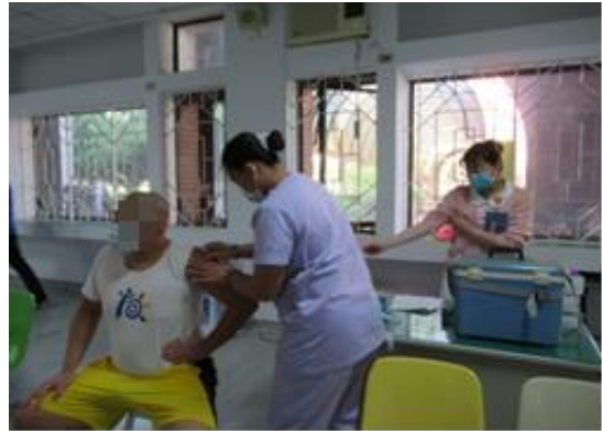
收容學生流感疫苗接種