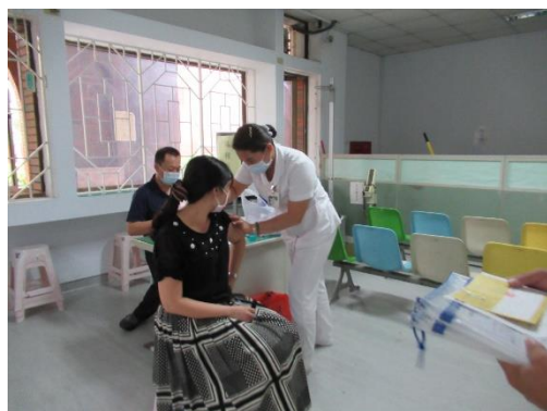
教職員工新冠肺炎 AZ 疫苗第二劑接種