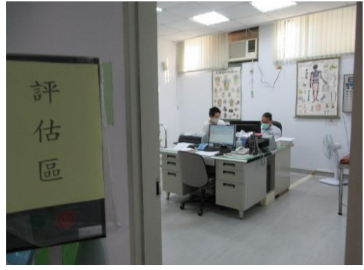
流感疫苗接種前評估