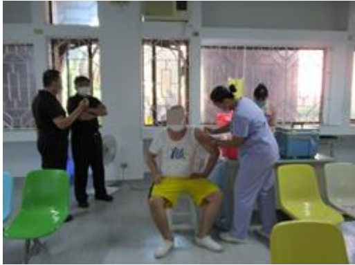
收容學生流感疫苗接種