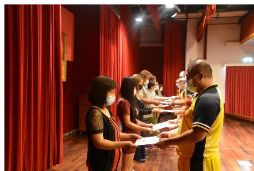
畢業生將畢業證書親自獻給自己家人情形