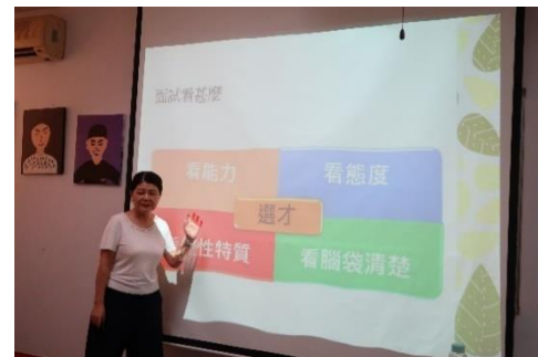
指導成員履歷撰寫、分析面試問題與傳授應對技巧-1