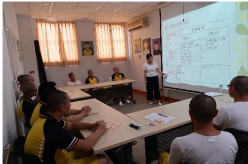
109年7月7日本校辦理收容人就業促進成長團體