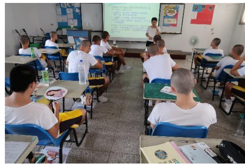
案例分享，認識相關勞動法規-2