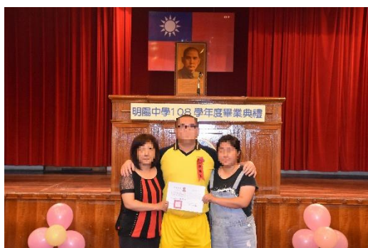
畢業生與參加親子聯誼會的家人合照情形