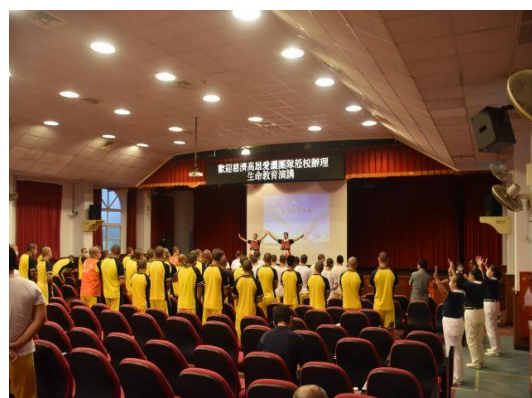
全校同學一起歡樂律動