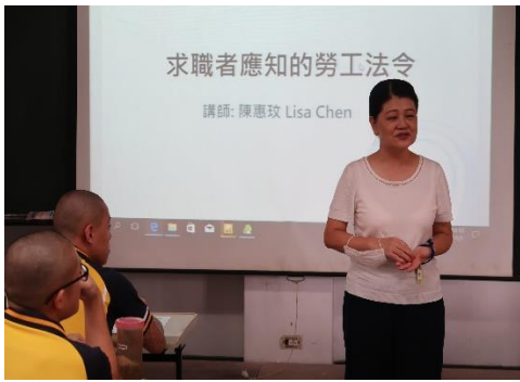
109年7月7日本校辦理收容人就業促進專題講座