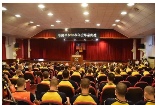
109 年 7 月 23 日舉行 108 學年度畢業典禮