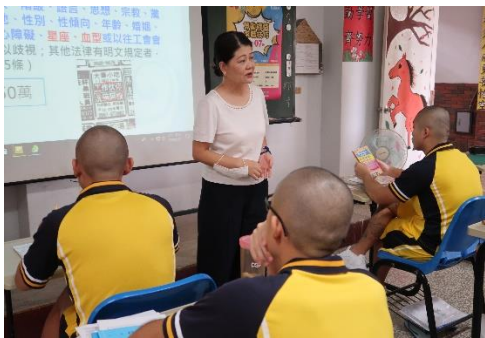
案例分享，認識相關勞動法規-1