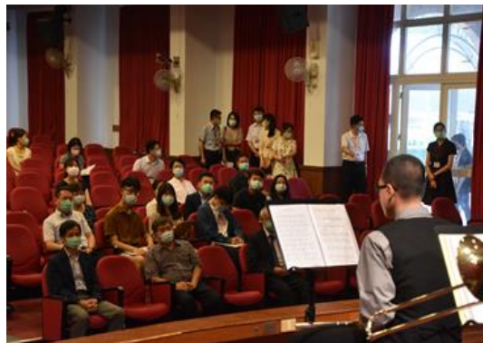
各級長官、貴賓、委員觀賞學生才藝表演