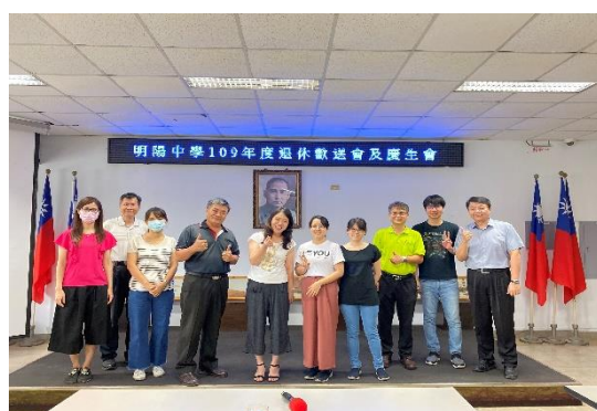
舉辦慶生會壽星合影留念(四)