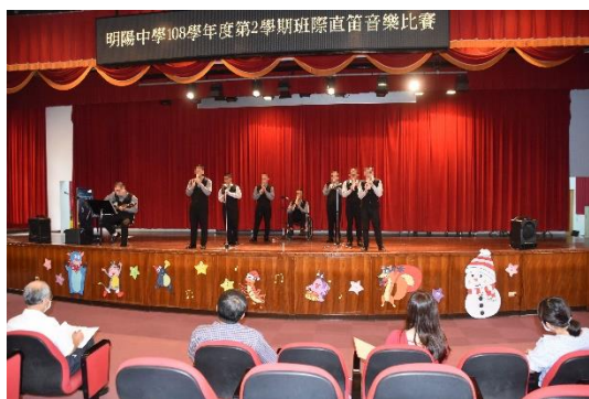
109年6月9日直笛音樂比賽學生演出情形(一)