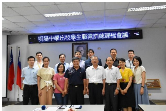
出校生職業訓練會議結束後校長、副校長、秘書及單位主管與貴賓大合照