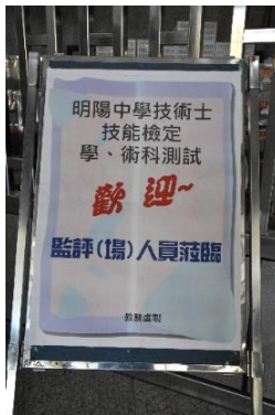
109 年技能訓練檢定歡迎海報