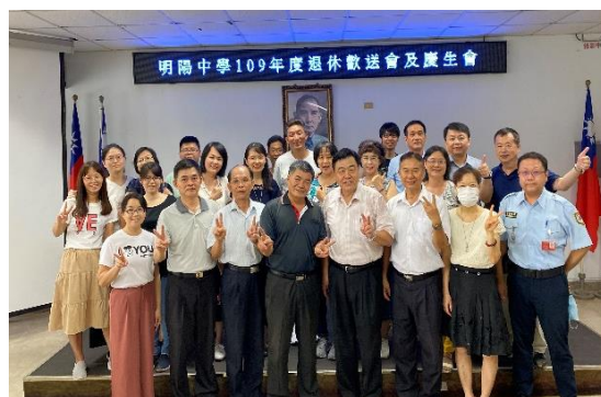
同仁與退休人員合影留念(二)