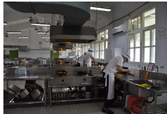
中餐烹調-術科考試