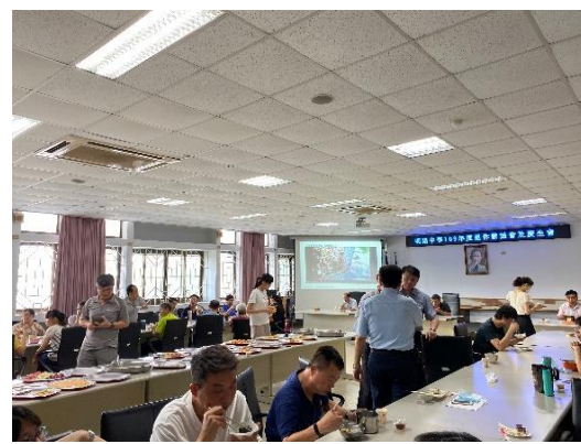
歡送會及慶生會同仁用餐話家常(八)