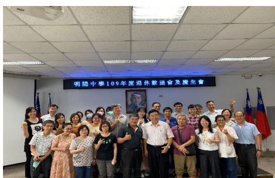
同仁與退休人員合影留念(三)