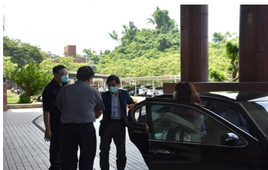
109年6月16日行政院兒童及少年福利與權益推動小組第三屆委員訪視明陽中學，法務部矯正署吳副署長澤生、校長涂志宏歡迎行政院林政務委員萬億蒞校