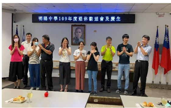
舉辦慶生會壽星合影留念(五)