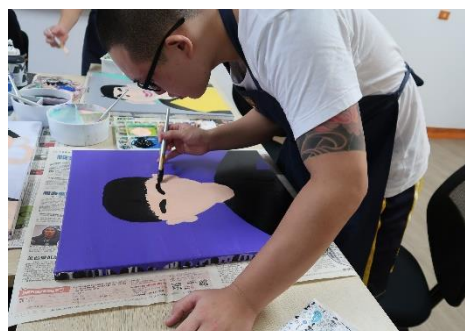
109 年 3-6 月辦理『藝起遊玩』情緒紓壓團體