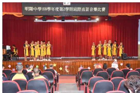
直笛音樂比賽學生演出情形(二)