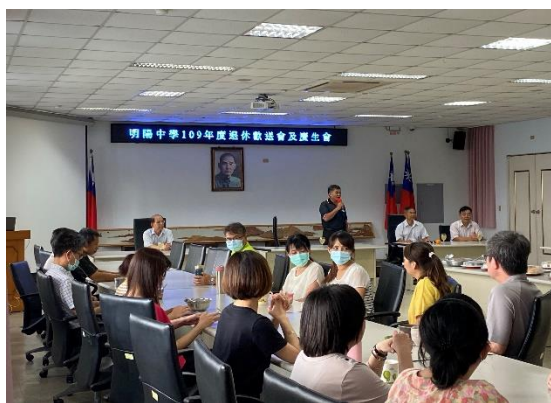
校長於歡送會中對退休人員讚揚對本校貢獻(七)