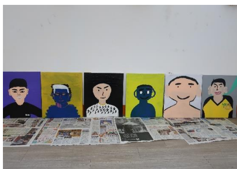
學生創作作品一覽