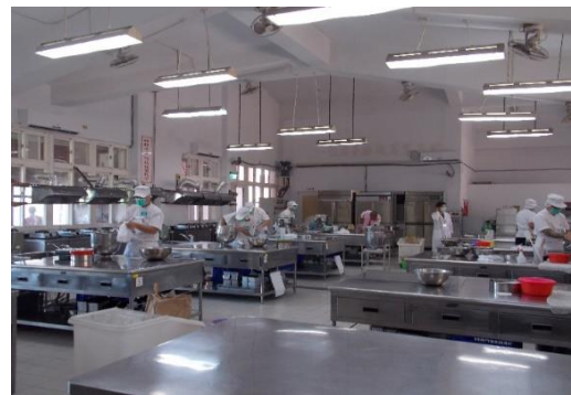
烘焙食品-術科考試