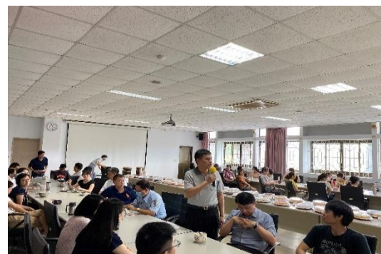
同仁對退休人員表達祝福與謝意(六)