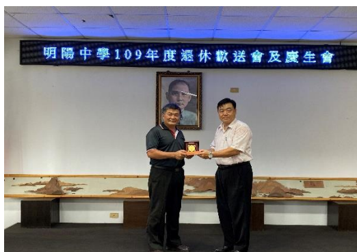
109年6月30日舉辦退休人員歡送會校長致贈紀念品(一)