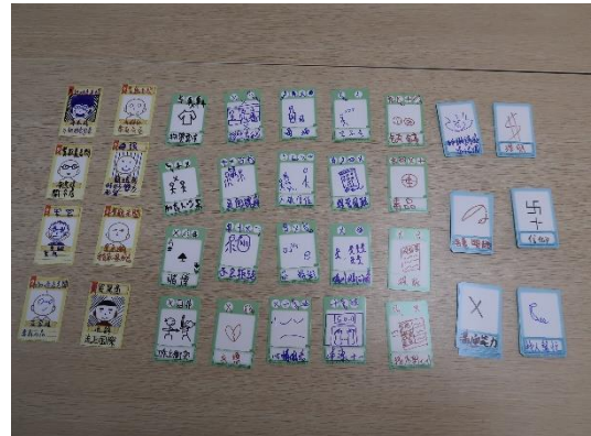
透過桌遊體驗課程，協助成員思考新生涯規劃