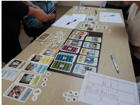
109年2月3日~10日辦理反毒冬令營