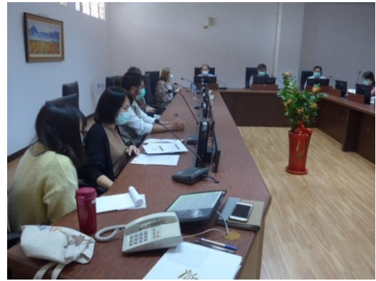
特殊教育推行委員會逐案討論