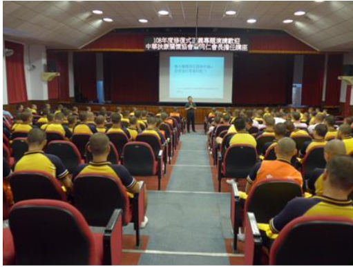
108 年 10 月 15 日修復式正義演講