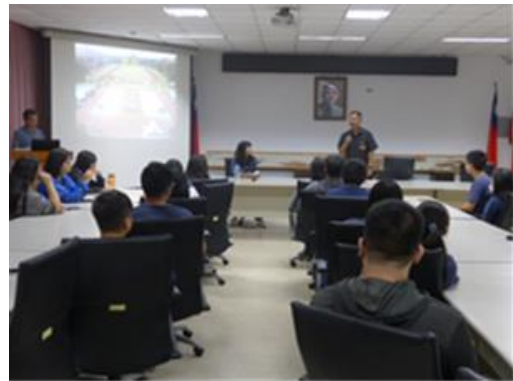
於本校會議室安排學校的簡介