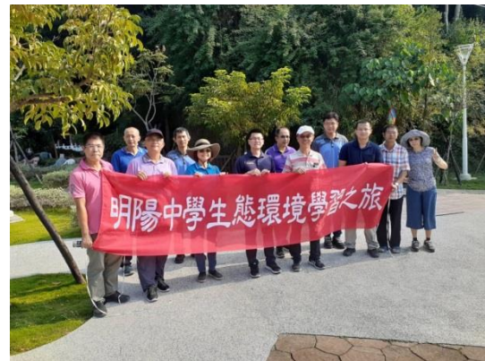
108 年 10 月 25 日環境教育生態研習