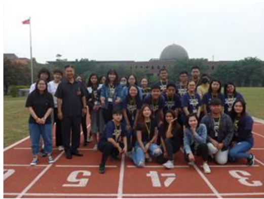
校園導覽中合影留念