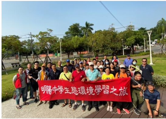
108 年 10 月 18 日環境教育生態研習