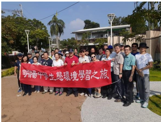
108 年 10 月 25 日環境教育生態研習