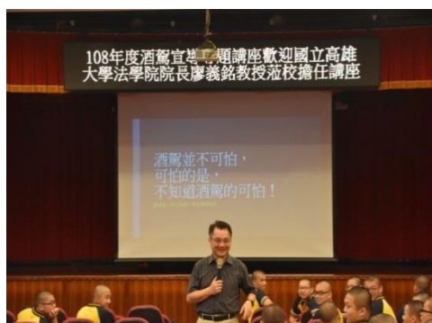
108年10月8日酒駕專題暨法律宣導 義銘教授上課實況