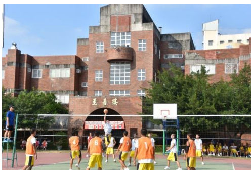
108年排球比賽-冠亞軍賽情形