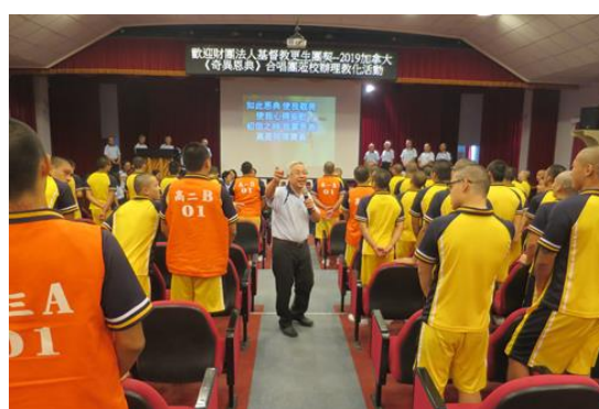
牧師更以破繭重生與學生分享