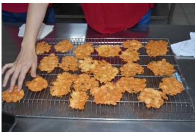
教職員工同仁歡欣呈現瓦片餅乾成品