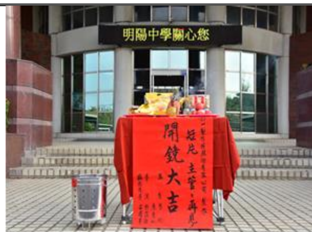
「主管，再見！」短片開鏡大吉