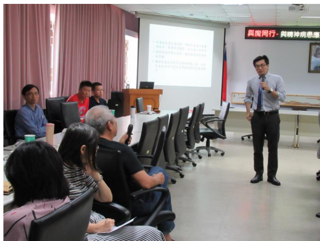
「與精神病患應對之技巧」座談會 3