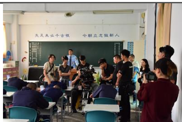
「主管，再見！」短片拍攝現場 1