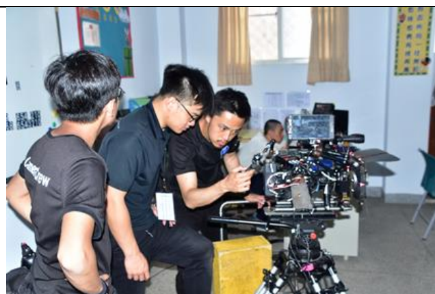
「主管，再見！」短片拍攝現場 2