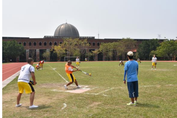
建校 20 週年系列活動-全校壘球比賽 1