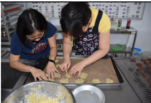
盈瑜老師、雅芳老師聚精會神教導瓦片餅乾整形