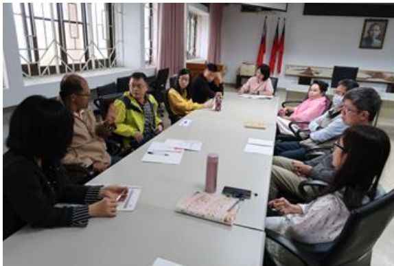
107 學年度第 3 次特教生 IEP 會議 3