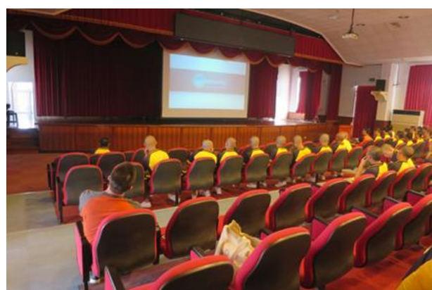
兒童及少年福利與權益保障法短片宣導