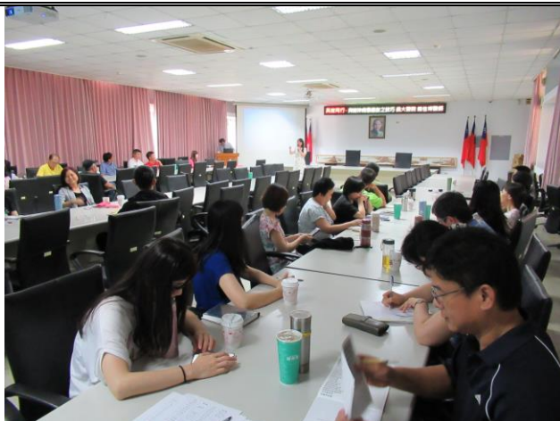
「與精神病患應對之技巧」座談會 1