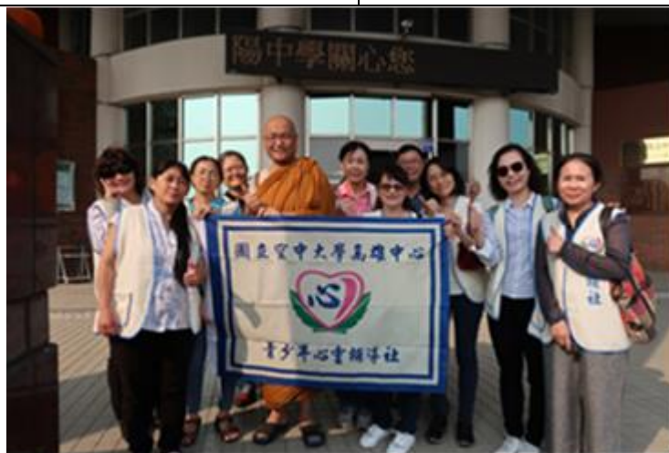
國立空中大學青少年心靈輔導社合照