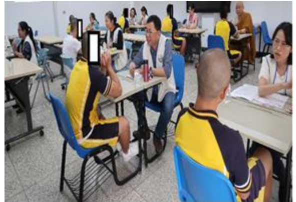
國立空中大學青少年心靈輔導社 入校關懷學生