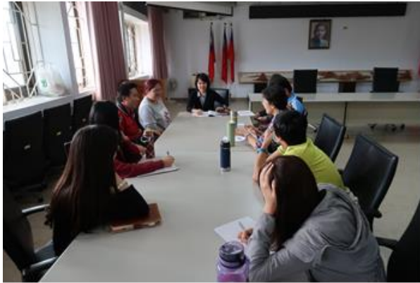
107 學年度第 3 次特教生 IEP 會議 1