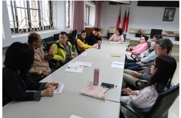
107 學年度第 3 次特教生 IEP 會議 2