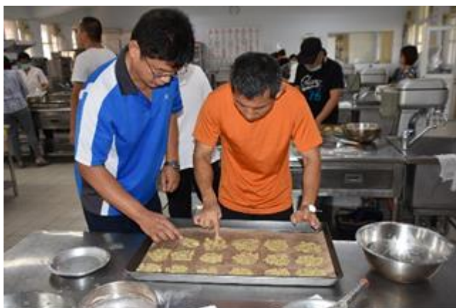
教職員工同仁專注用心瓦片餅乾整形