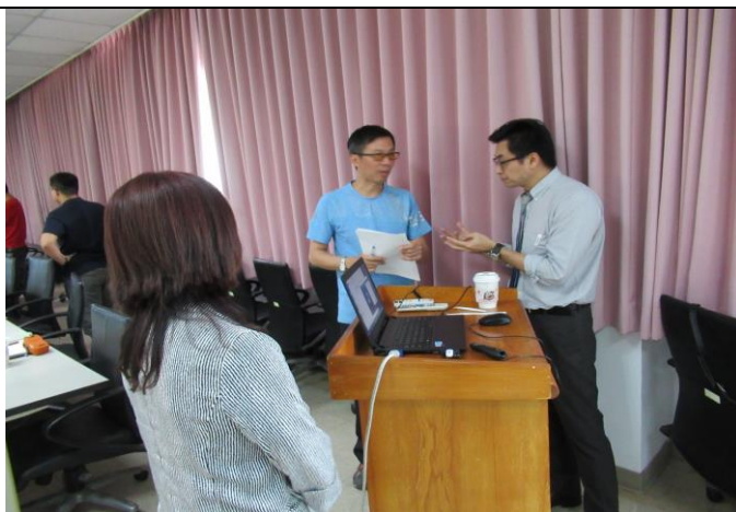
「與精神病患應對之技巧」座談會 2