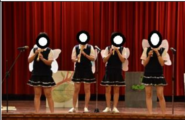
學生比賽中直笛演奏情形 1