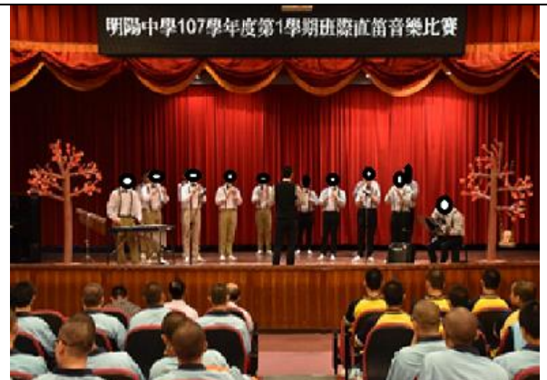
學生比賽中直笛演奏情形 2