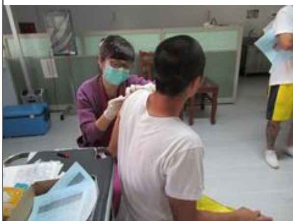
收容學生接種流感疫苗