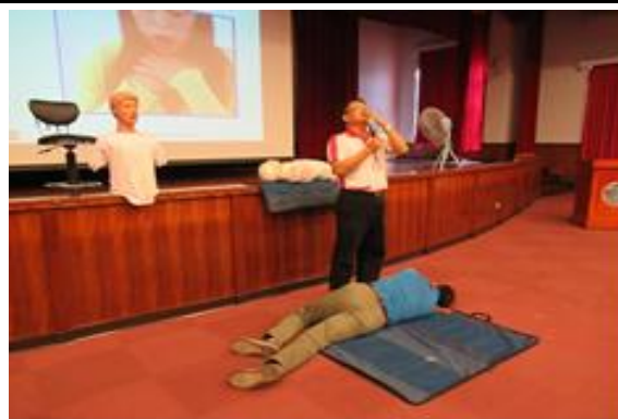
講師宣導講解復甦姿勢