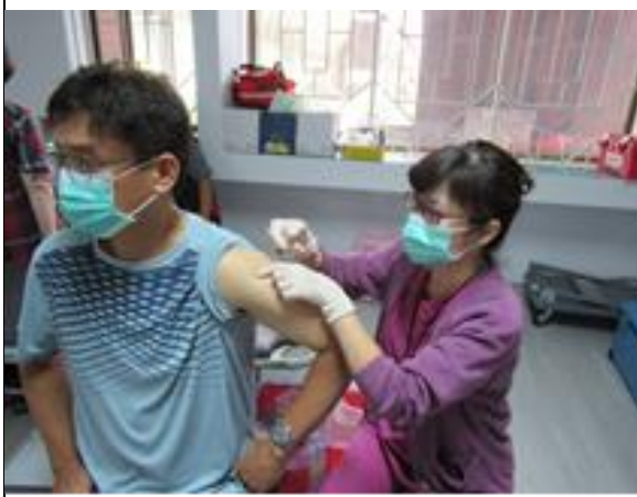
教職員工接種流感疫苗