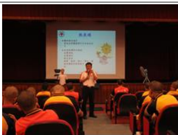
講師宣導講解熱衰竭