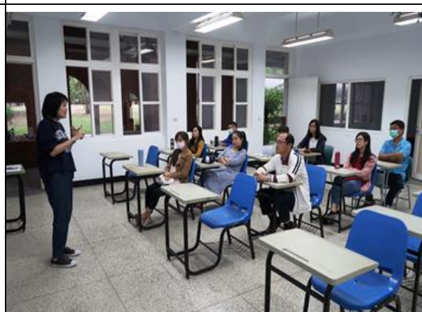
107 學年度第 02 次 IEP 會議 2