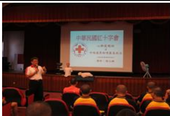
講師宣導講解急救概念