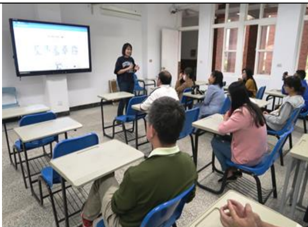
107 學年度第 02 次 IEP 會議 1