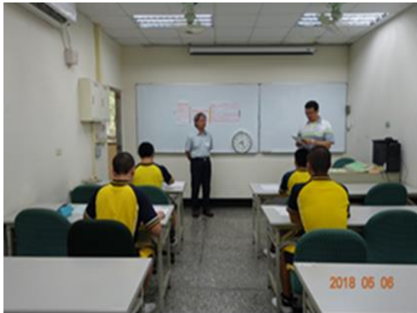
四技二專統一入學測驗試場