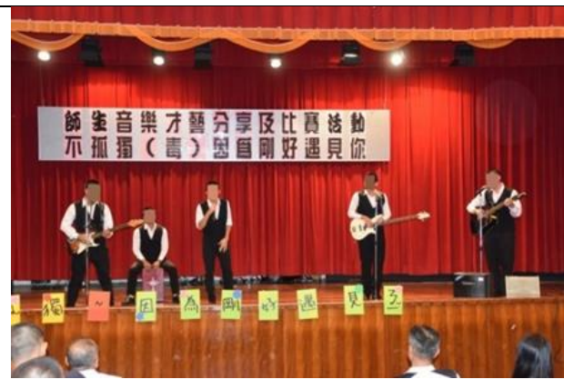
第一名高二C班表演