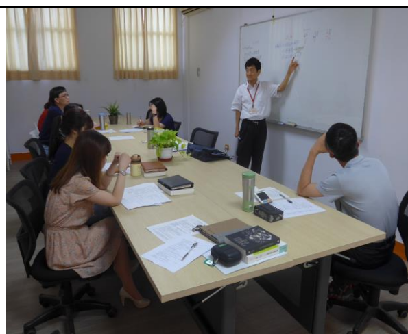
個案督導會議(文藻外語大學陳清泉教授)