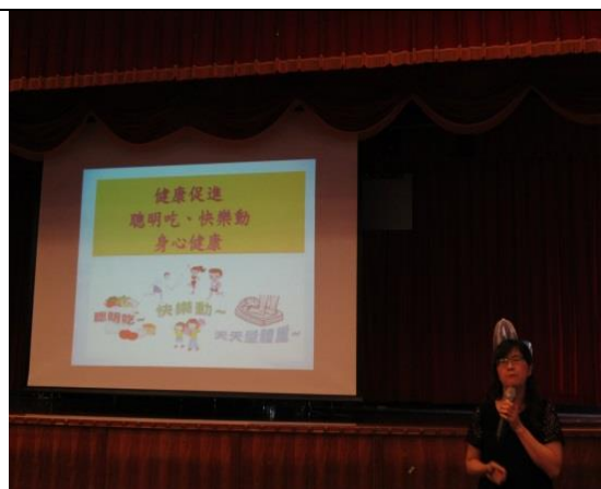
健康促進的要領講解