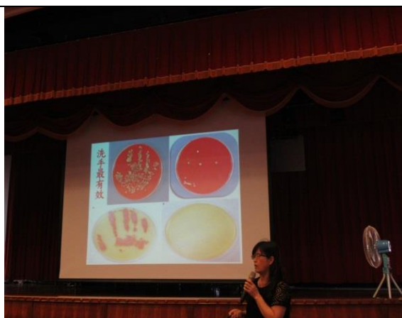
洗手與健康的要領講解