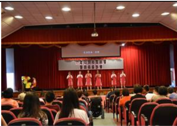
高三 E 班學生表演