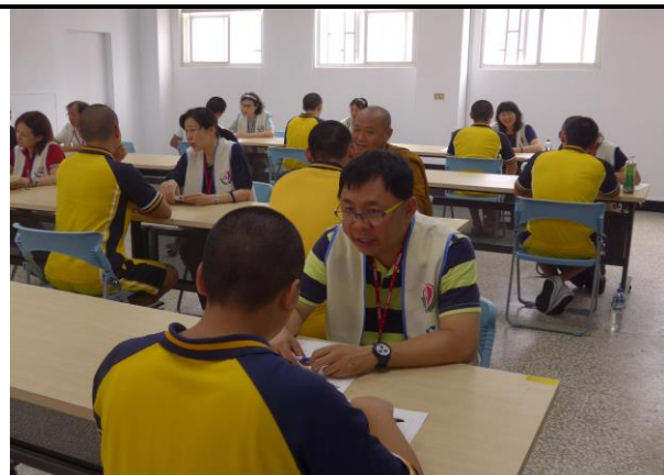
國立空中大學高雄中心青少年心靈輔導社(1)