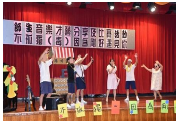
第二名高三B班表演