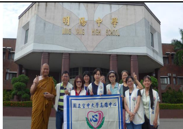
國立空中大學高雄中心青少年心靈輔導社(2)