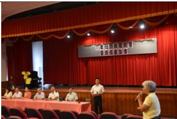
林姓同學母親分享