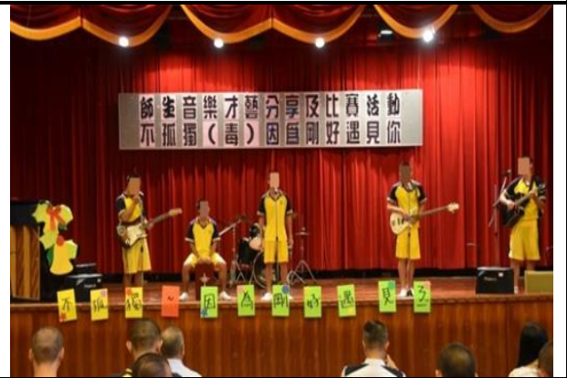
高二C班樂團開場表演