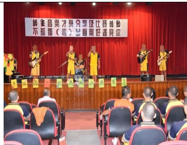
第三名高三A班表演