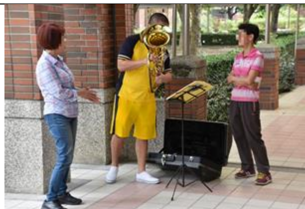
學生展現學習成果與家人分享