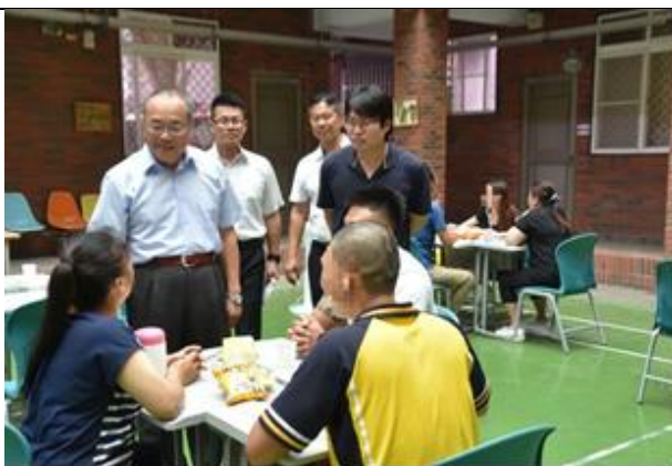
校長親臨懇親會場並與家屬話家常 2