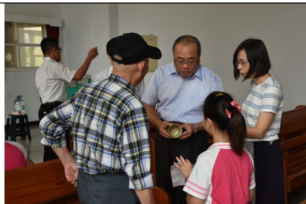
校長親臨懇親會場並與家屬話家常 1