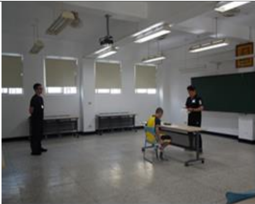
國中教育會考本校試場