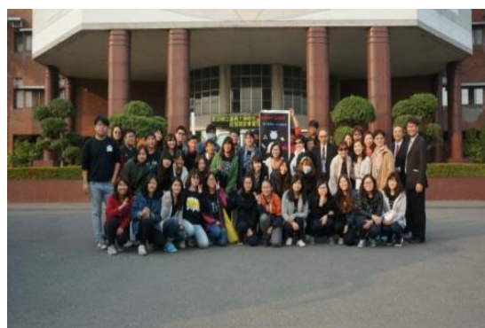
※嘉義大學師生全體合照