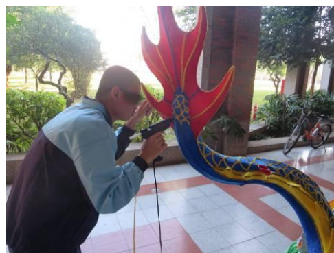
※作品名稱「雲起龍來(運氣攏來)」盼祥龍翻騰在雲林，讓新的一年可以帶來喜氣降臨和好運攏總來