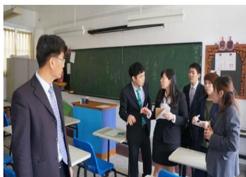
※106.3.6 日本學者參觀學生教室