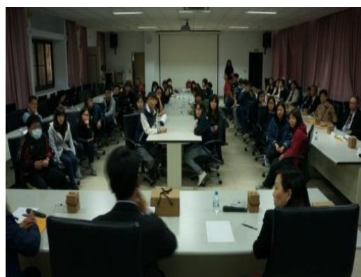
※106.3.3 嘉義大學師生座談會