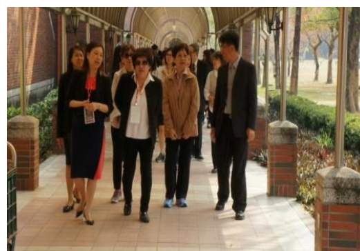
※校長全程陪同參觀校園