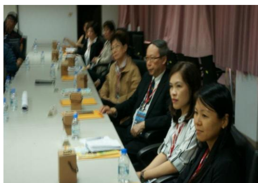
※106.3.3 新加坡司法處遇工作者之參訪座談會