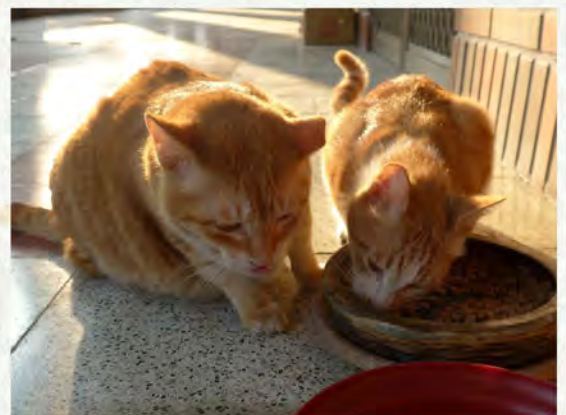
胖橘子 & 小奶油

文學家夏目漱石用貓來深省時事，筆者才學疏淺，只是用貓來描述事實，如果覺得以上所說的貓故事，與您所認識的生命故事有所雷同，那只能說明世間道理本就相通，放下尊卑，萬物皆是我們的老師。心存善念，就算禍福相倚時，福與禍都能同時豐厚我們的生命。如果下次您有機會來訪明陽中學，不妨低下頭找找我們躲在各個角落的貓族們，他們可是我們明陽中學的重要風景呢！！