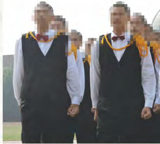
金獎 高二 A

104年12月的某一天上午，陽光在灰藍的天空中伺機現身，全校師生匯集籃球場，各班同學準備進行一場較量，過程中，無不使出絕技，盼能獲得評審青睞，榮獲桂冠。以下由前3名班級與評審代表分享這場比賽的點滴：