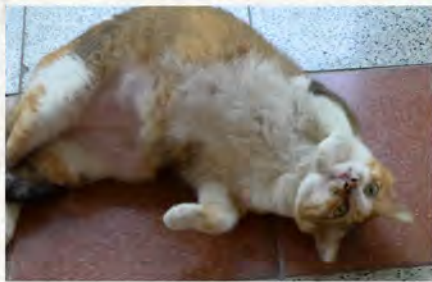
(上) 橘子 & 灰太郎 (中) 最萌小貓奶油 (下) 愛撒嬌的小花