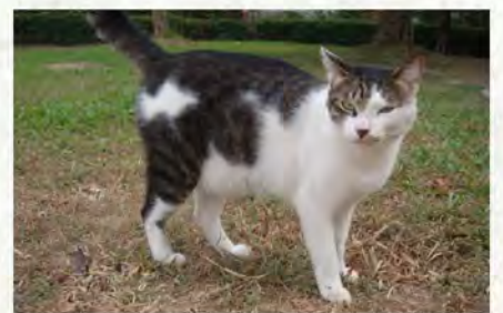
(上)貓世界 (中)黑豆一家人 (下)混混