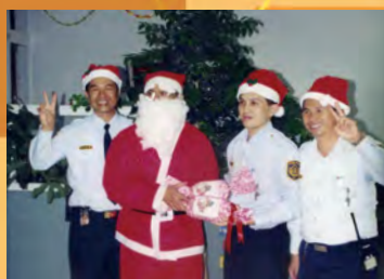
◆ 聖誕老公公發送糖果