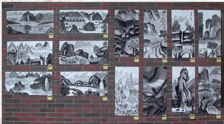
▲ 暑期樂學營—生水墨習作作品聯展