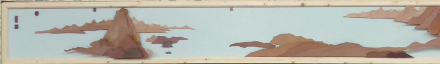
▲ 富春山居圖—木工版