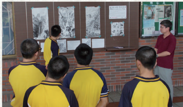
▲ 高三 C 班校內水墨臨帖展—學生講解自己的作品