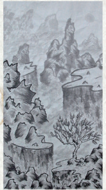
▲ 暑期水墨樂學營作品展一學生作品