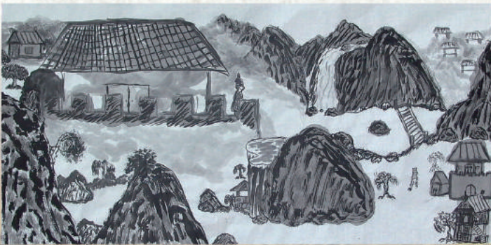
▲ 暑期水墨樂學營作品展一學生作品

「富春山居圖可以這麼玩！」 富春山居圖以八開之幅，展現富麗堂皇氣派，山水樓閣佔其中心，雲氣、富春山居之境，讓我們感受這高三C同學之創作經驗。與老師共同創作，這不僅是一次藝術創作的過程，也是同學們的心路歷程。更是一次難忘的經歷。從一張畫作到一幅山水畫的創作，到最後一幅山水畫的完成，同學們體驗了這幅山水畫的創作過程。在這幅山水畫的創作中，同學們體驗了這幅山水畫的創作過程。在這幅山水畫的創作中，同學們體驗了這幅山水畫的創作過程。