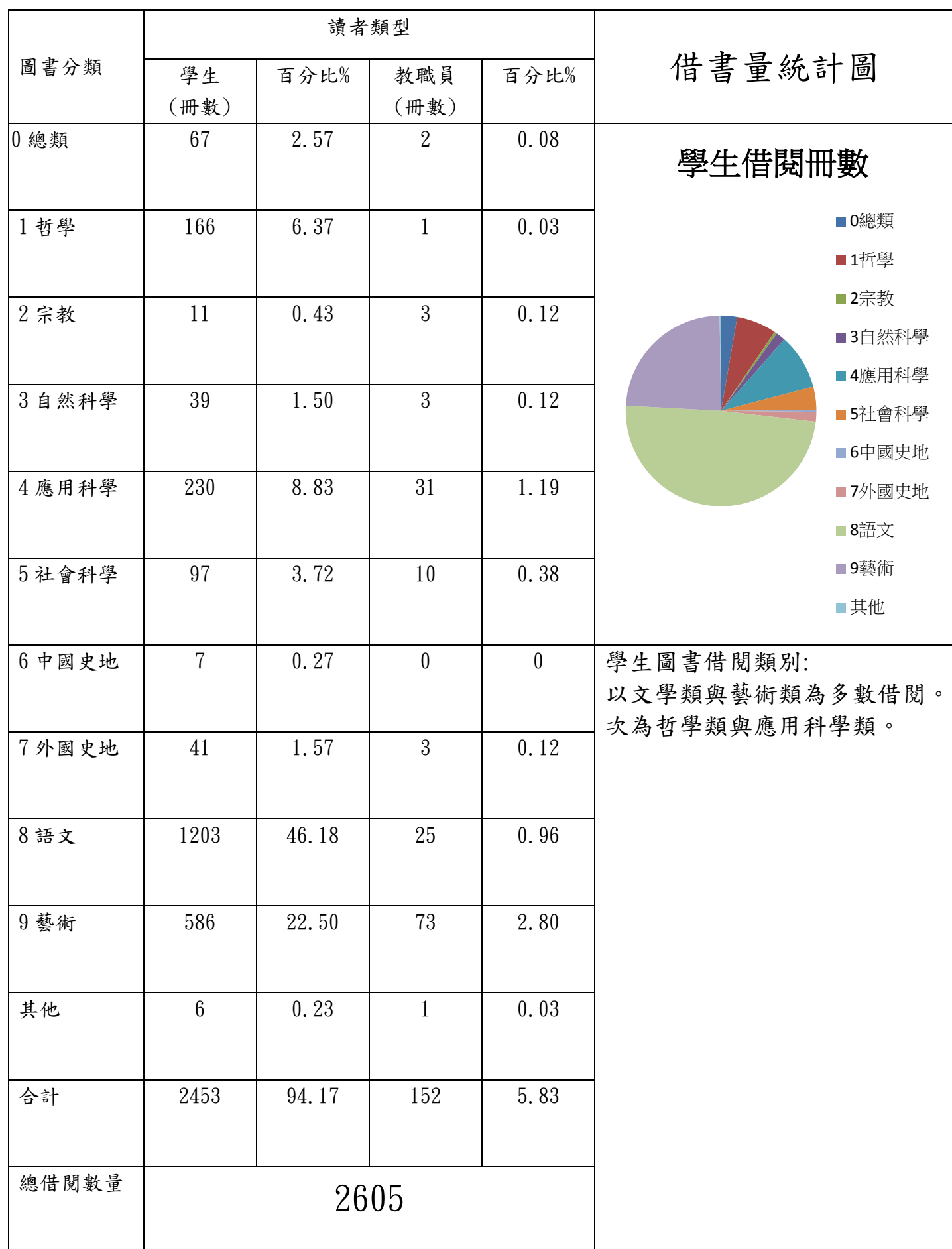
明陽中學圖書館 106 年 03 月份借書量統計報表