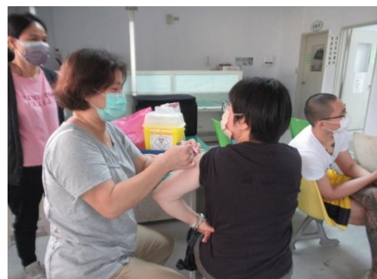
教職員工流感疫苗接種(2)