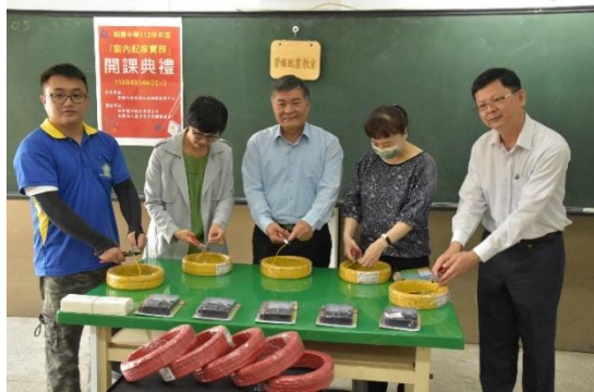
「剪線」之類剪綵儀式