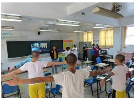
外國專班學生指導學生肢體伸展方式