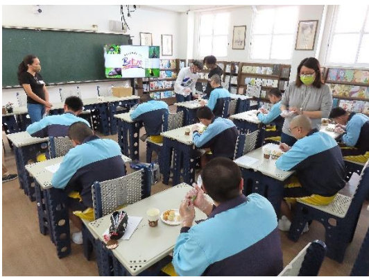
外國專班學生教導學生製作點心