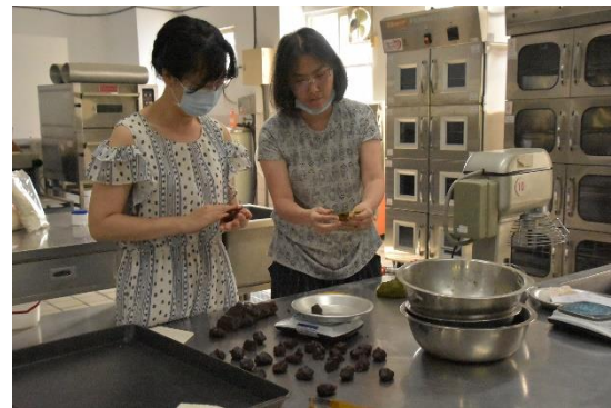
參與教師實務操作-平均切塊