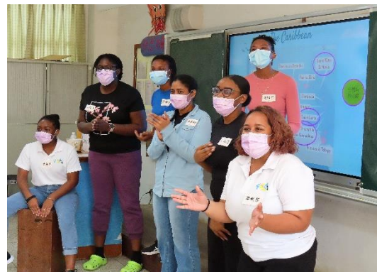
外國專班學生與本校學生熱烈互動