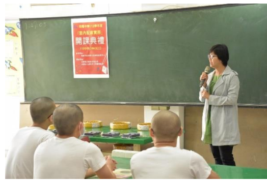
「高雄市勞工局訓練就業中心」黃主任致詞