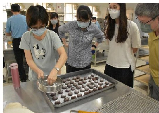
參與教師實務操作-灑糖粉