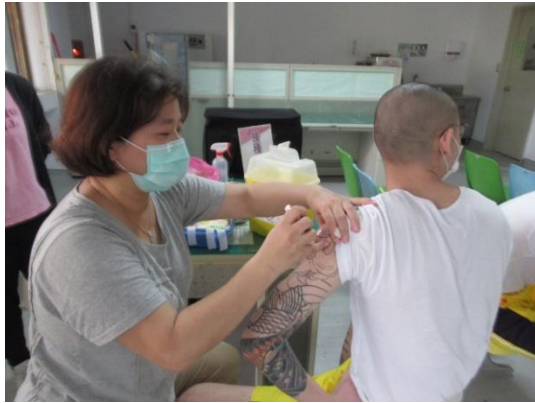
113 年 3 月 5 日實施收容學生暨教職員工團體 接種公費流感疫苗---學生流感疫苗接種(1)