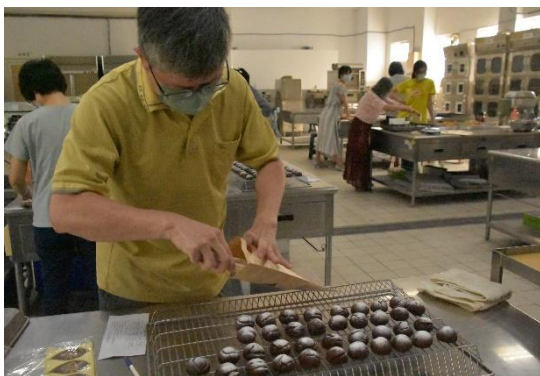
參與教師實務操作-完成品裝袋