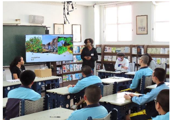
義守大學外國專班學生介紹國家風情