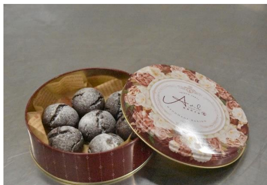
參與教師實務操作-完成品裝盒