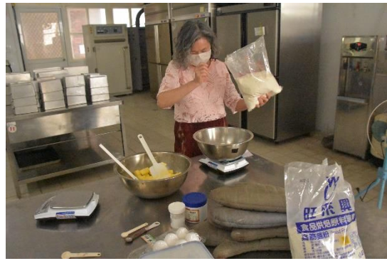
參與教師實務操作-精確秤重