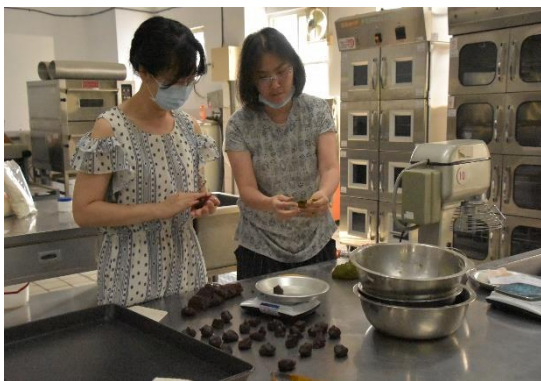
參與教師實務操作-灑糖粉