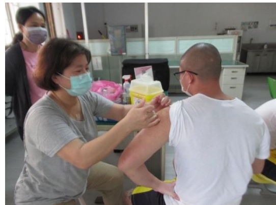
學生流感疫苗接種(2)