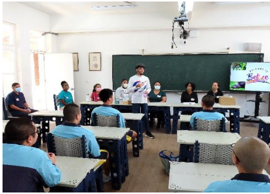
113年3月13日明陽中學與義守大學學士後醫學系外國學生專班共同辦理學生交流活動