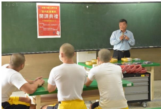
113年3月6日辦理「室內配線實務」訓練課程，涂校長致詞