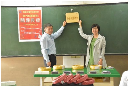
涂校長與黃主任共同掛牌儀式