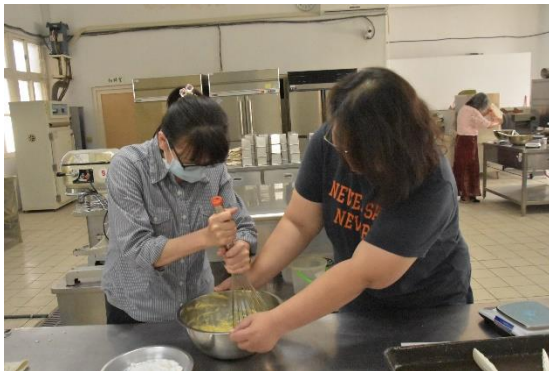
參與教師實務操作-將麵粉及奶油攪拌均勻