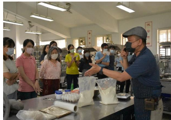
餐飲科教師介紹原料