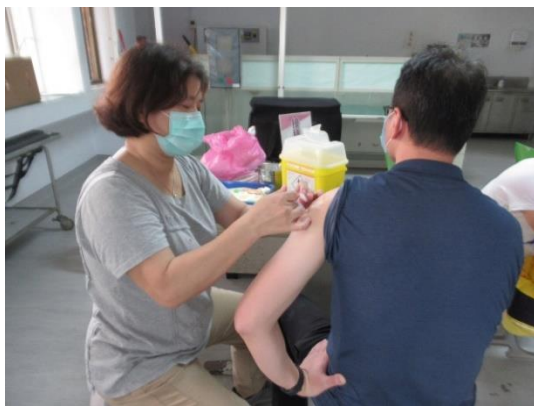
教職員工流感疫苗接種(1)