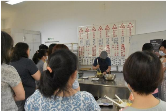
餐飲科教師講解示範