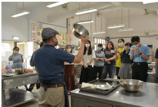
113年3月25日辦理教師增能研習-「餅乾製作」--餐飲科教師介紹器具