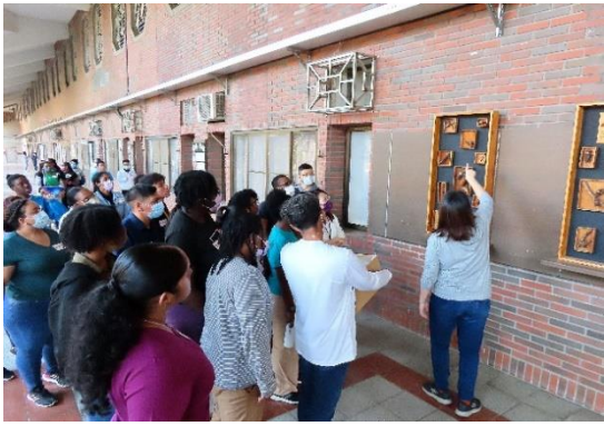
外國專班學生參觀校園環境及設施